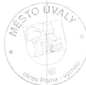
MUDr. Jan Šťastný starosta města Úvaly