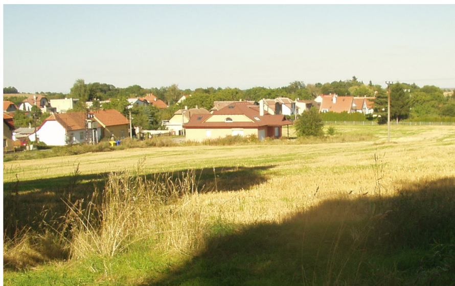
Pozemky na Slovanech těsně před prodejem