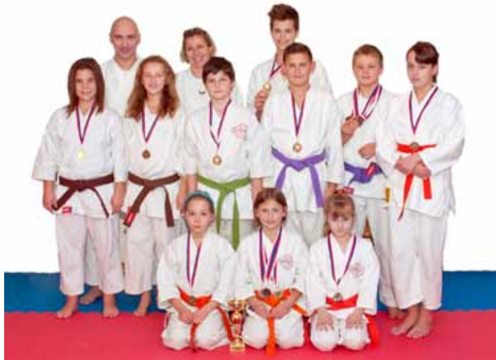
Medailisté MČR 2013 a trenéři Sport Úvaly: