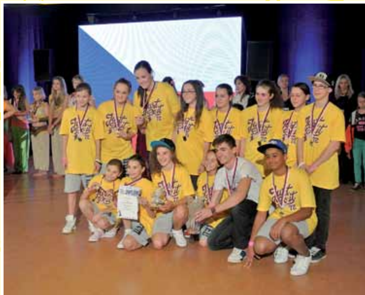
Large Teams junioři do 15 let – „Juniors“ - Urban Street