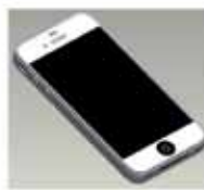
Dostupnost internetu kdykoliv a kdekoliv

Právě malá městská knihovna dává základ budoucím čtenářům. Centrální portál nám vlastně nahrává k udržení čtenářů po celou