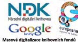
Masová digitalizace knihovnických fondů