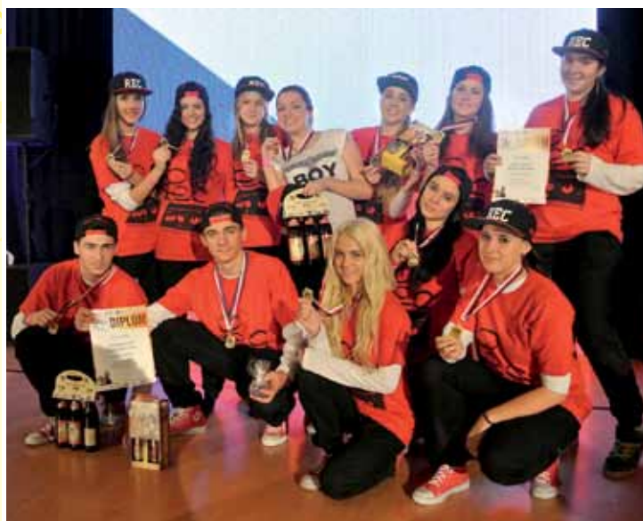
Large Teams mládež a dospělí – „Inform Dobalina“ - Urban Street