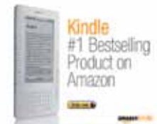
Prodej a využívání e-knih