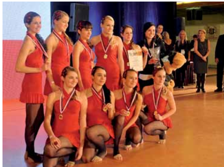
Large Teams mládež a dospělí – „Ladies Night“ - Contemporary Ballet