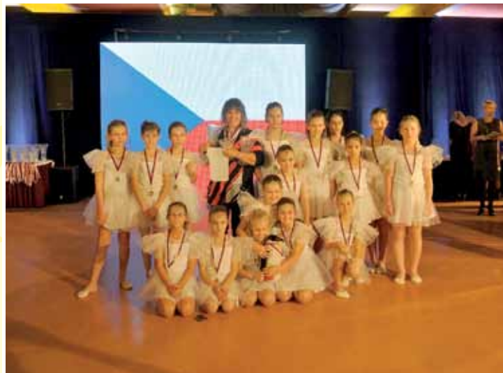
Large Teams děti do 11 let – „Mischievous comet“ - Contemporary Ballet