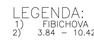
Podélný profil stoky BA-3