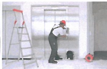
Servis 24 hodin