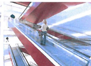
Eskalátory & pohyblivé chodníky