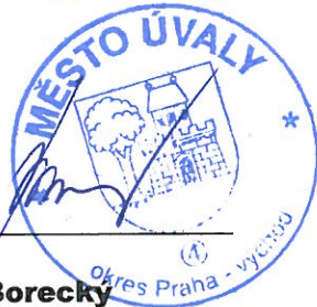
Petr Borecký starosta města Úvaly