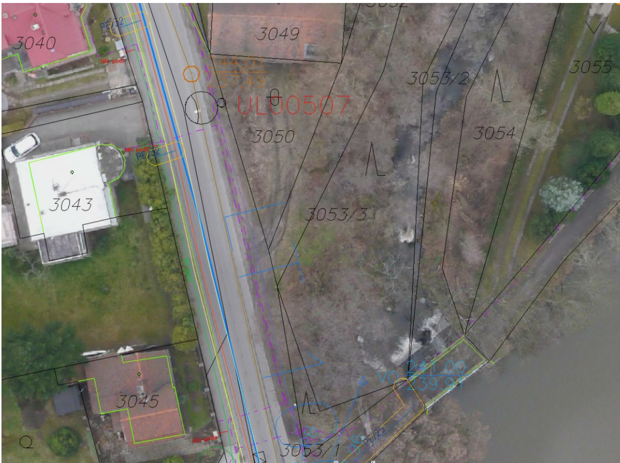
2/3 Převzatý zákes ing. sítí z technické mapy města Úvaly – detailněji viz https://uvaly.obce.gepro.cz/#/