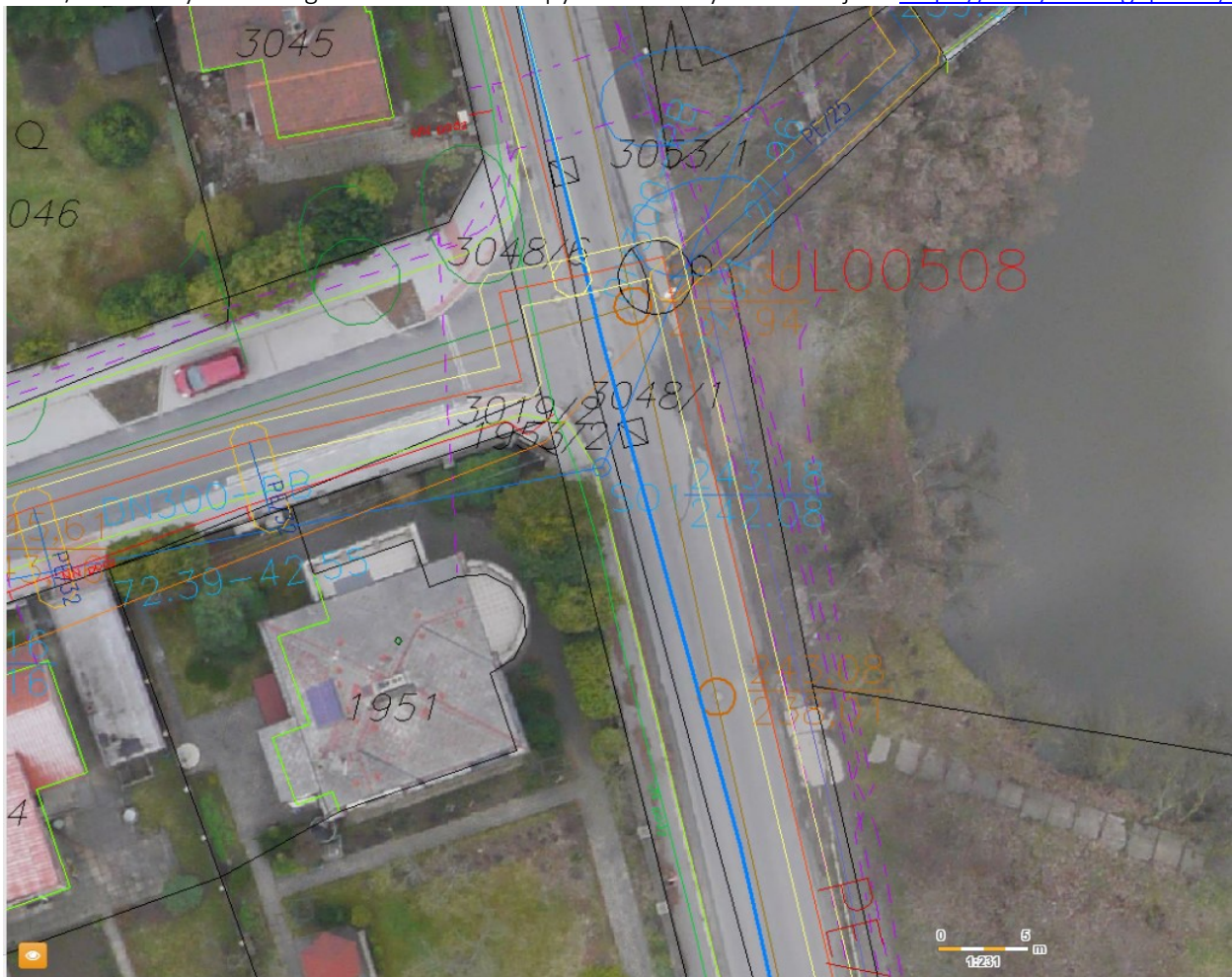
3/3 Převzatý zákes ing. sítí z technické mapy města Úvaly – detailněji viz https://uvaly.obce.gepro.cz/#/