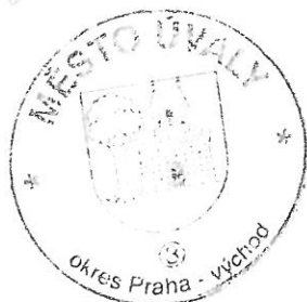
..... razítko města