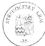
..... razítko Středočeského kraje