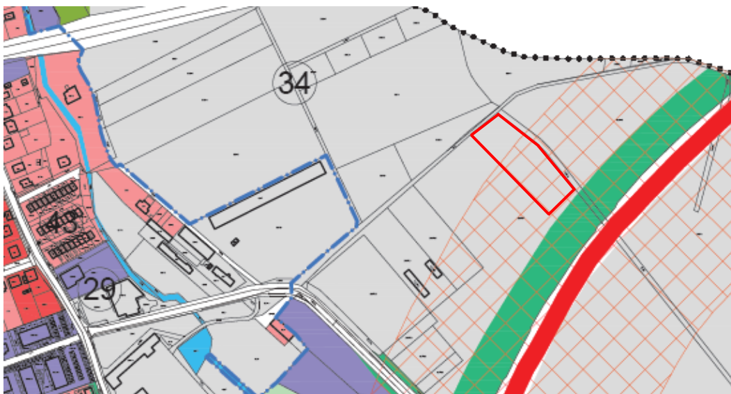
Úplné znění územního plánu sídelního útvaru (ÚPSÚ) Úvaly po změně č.12 (stav ke dni 31.5.2023)

Návrh novostavby skladovací haly spadá pod hlavní využití: sklady, skladovací plochy a kancelářské prostory firmy Doypacky s.r.o.. Návrh novostavby skladovací haly dodržuje hmotové a měřítkové připodobnění k nízko-podlažním halovým objektům. Záměr je v souladu s cíli a úkoly územního plánování §18, §19 Stavebního zákona č. 183/2006 Sb. Pozemek je dále dotčen koridorem plánované přeložky silnice I/12 Běchovice / Úvaly.