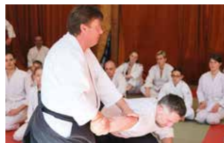
Aikidó Úvaly vstoupí...