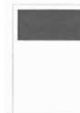
1/3 strany 190x87 mm