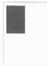
1/4 strany 90x128 mm