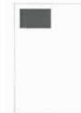
1/8 strany 90x61 mm

Dodané inzeráty musí mít tiskovou kvalitu - 300 dpi, formát *.pdf nebo jednotlivé komponenty - logo (*.eps, *.tif, *.jpg), obrázky (*.eps, *.tif, *.jpg), texty (*.txt, *.doc) - v elektronické podobě. Inzeráty budou přijímány pouze podle formátů uvedených výše.