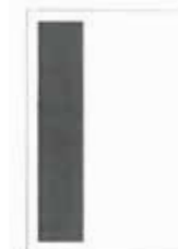
1/3 strany 59x262 mm