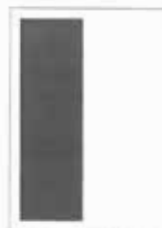
1/2 strany 90x262 mm