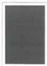
1/1 strany (zrcadlo) 190x262 mm 1/1 na spad 210x297 mm