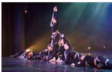
Ohlédnutí za taneční...