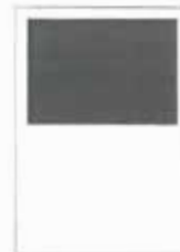
1/2 strany 190x128 mm