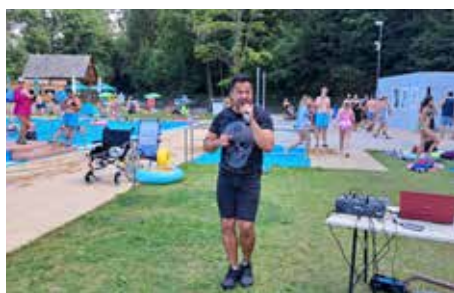
Lístky z kalendáře...