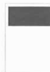
1/3 strany 190x87 mm