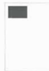
1/8 strany 90x61 mm

Dodané inzeráty musí mít tiskovou kvalitu - 300 dpi, formát *.pdf nebo jednotlivé komponenty - logo (*.eps, *.tif, *.jpg), obrázky (*.eps, *.tif, *.jpg), texty (*.txt, *.doc) - v elektronické podobě. Inzeráty budou přijímány pouze podle formátů uvedených výše.