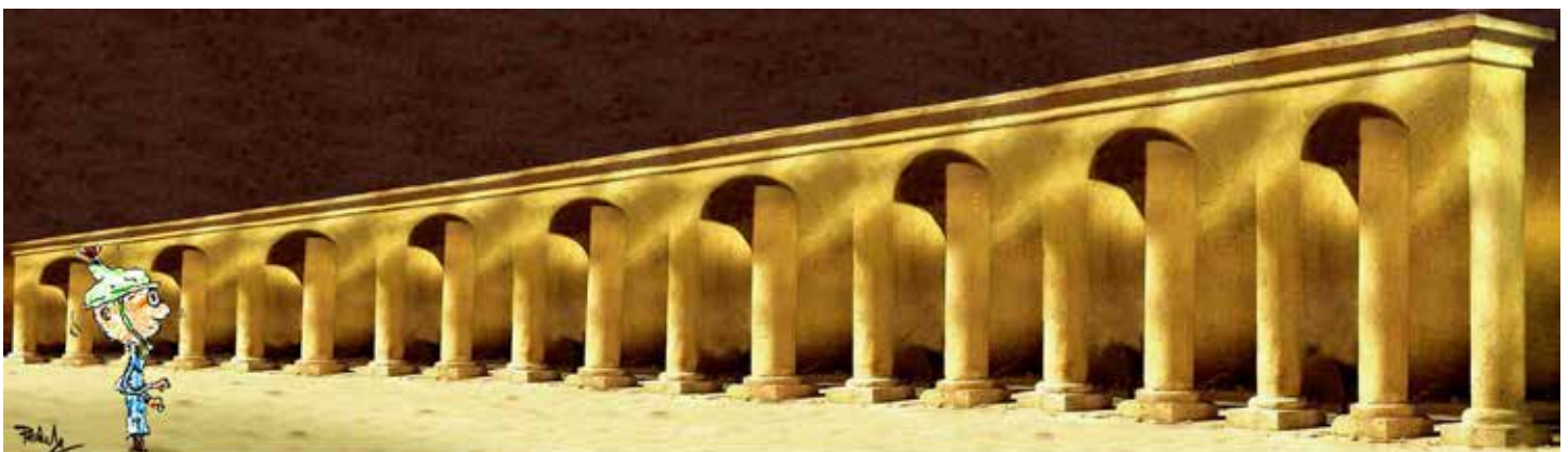
TO JSEM Z TOHO BLÁZEN !! DYT V ŽIVOTĚ ÚVAL PSALI, ŽE JE TADY OBLOUKŮ DEVĚT !!!