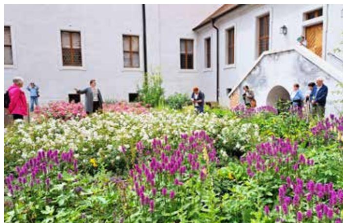
● Alena Janurová

V září nás čeká první schůzka už 4. 9. (což asi čtenáře ŽÚ mine) s jednoduchým hádankovým programem Kdo jsem?, kde se dohodneme i na dalším typu programů schůzek, které klub nejvíc baví. Máme už domluvené i Podzimní vyrábění a brzy si zase zazpíváme při harmonice. 2. 10. v rámci klubové středy město uspořádá opět setkání ke Dni seniorů s milým programem.