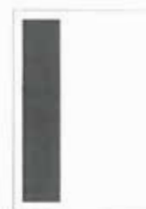
1/3 strany 59x262 mm