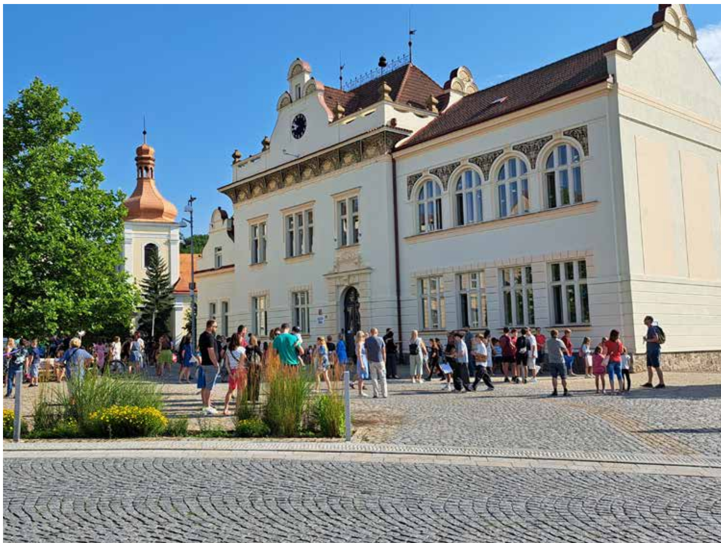
V červnu ven a v září tam