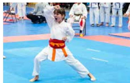
Vánoční turnaj karate 13