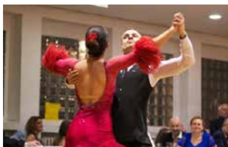
Třiadvacaté městské plesání 8