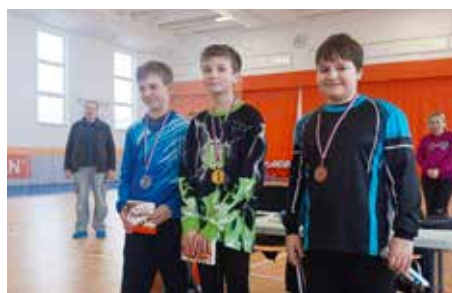
První soutěž v novém roce 11